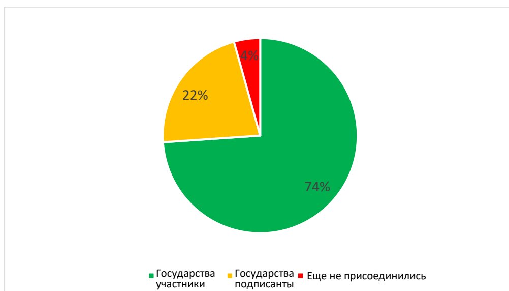
Диаграмма 2. Государства, получившие спонсорское финансирование: по статусу ДТО

21. На диаграмме 2 показано, что из 23 государств, получивших спонсорское финансирование для участия в первой серии заседаний цикла КГУБ, 17 государств являются государствами — участниками ДТО (74%), пять государств являются государствами-подписантами (22%) и всего одно государство еще не присоединилось к Договору (4%).